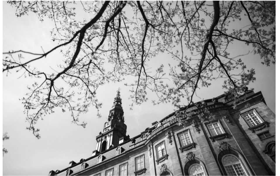
Efter mange års forarbejde er en sammenskrevet lejelov nu på vej til at blive vedtaget på Christiansborg.

I begyndelsen af 2000-tallet startede forhandlingerne mellem på den ene side Ejendomsforeningen Danmark og Danske Udlejere og på den anden side Lejernes LO, Danmarks Lejerforeninger og Bosam. Boligministeriet skulle fungere som sekretariat.