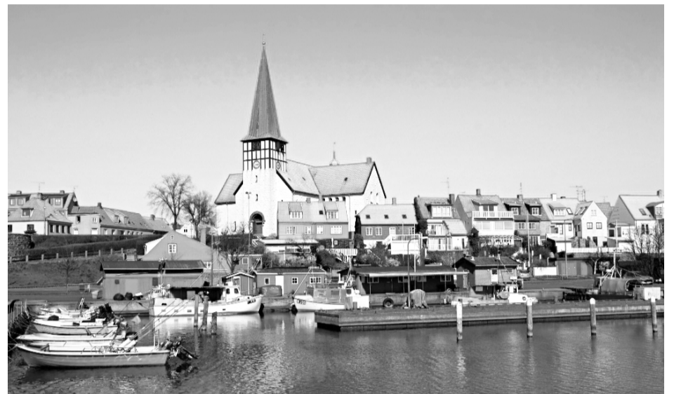
I Rønne bor de private lejere i småhuse

Da lejerens lejlighed var 85 m 2 blev den årlige leje 53.125 kr svarende til 4.427 kr pr måned. Lejer fik dermed 973 kr retur i 12 måneder.