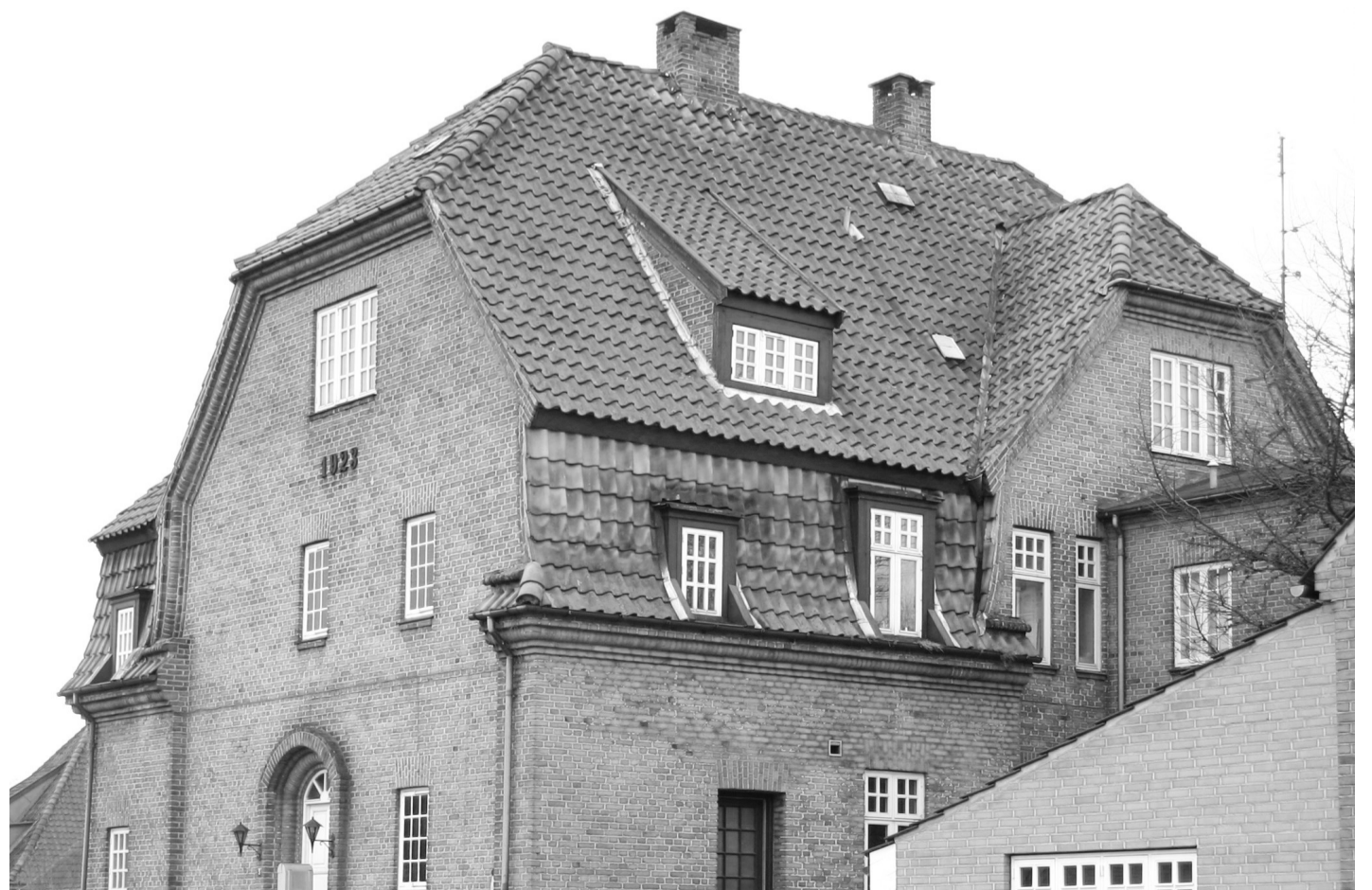
Småhus i Køge med 3 boliger

Desværre skete der ikke mere. Den daværende regering (Socialdemokratiet, Socialistisk Folkeparti og Radikale Venstre) fik travlt med deres eget lovforslag til ændring af lejeloven og forslaget om småhusreglerne gik i glemmebogen. Men det er aldrig for sent at rette op på noget, man har glemt.