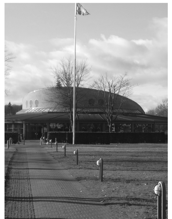
Ellemarken er den største afdeling i KaB

En enkelt afdeling, Nordgården havde allerede før 2014 et meget højt opsamlet overskud på konto 407 på 13.276 kr pr bolig . I 2019 forøgede man tilbageførslen af penge til lejerne, således at der er kommet et lille nettounderskud for perioden på 443 kr årligt pr bolig . I denne afdeling har DaB ikke anvendt bogføringsfinten.