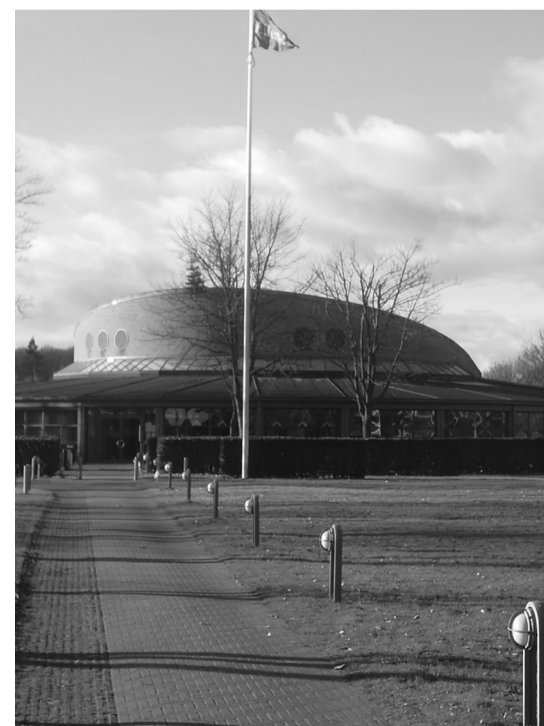
Ellemarken er den største afdeling i KaB

En enkelt afdeling, Nordgården havde allerede før 2014 et meget højt opsamlet overskud på konto 407 på 13.276 kr pr bolig . I 2019 forøgede man tilbageførslen af penge til lejerne, således at der er kommet et lille nettounderskud for perioden på 443 kr årligt pr bolig . I denne afdeling har DaB ikke anvendt bogføringsfinten.