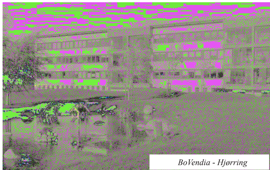
BoVendia - Hjørring

Balancelaje betyder ikke, at der ikke må være overskud på afdelingernes regnskaber. Selv den mest kompetente og omhyggelige administrator kan aldrig ramme 100 % plet, når vedkomende lægger budget for boligafdelingen.