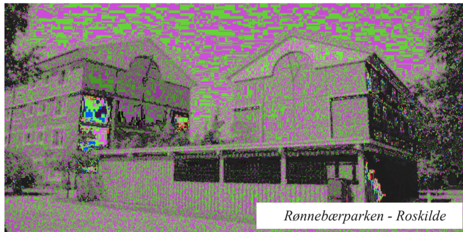
Rønnebærparken - Roskilde

Der vil altid være uforudsete udgifter og indtægter. Nogle år får afdelingen overskud, og nogle år underskud, men erfaringen viser, at det er muligt for en administrator at ramme balancelaje, således at det opsamlede overskud højst bliver 5.000 kr pr bolig.