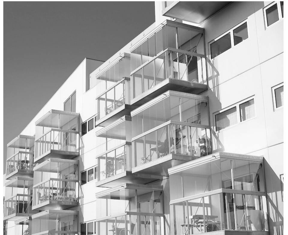
De 31 beboere i Baldershus kan nedsætte deres leje i 2021 med 2.850 kr pr. måned.