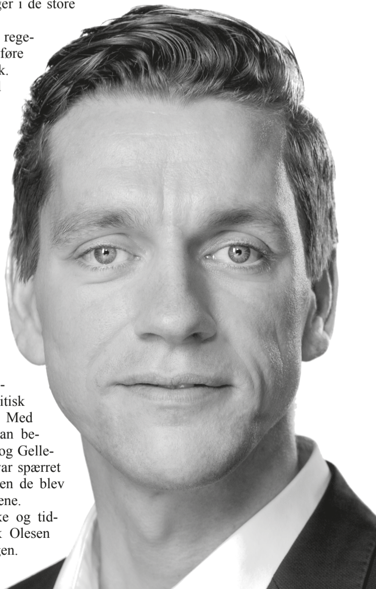
Boligminister Kaare Dybvad

Og som om dette ikke er nok, tvinger man boligorganisationer til at bære en kostbar administrativ byrde med at udarbejde de såkaldte helhedsplaner. Disse planer vil sandsynligvis være spildt, fordi det alligevel ikke vil hjælpe yderligere på problemerne med integration i de udsatte boligområder.