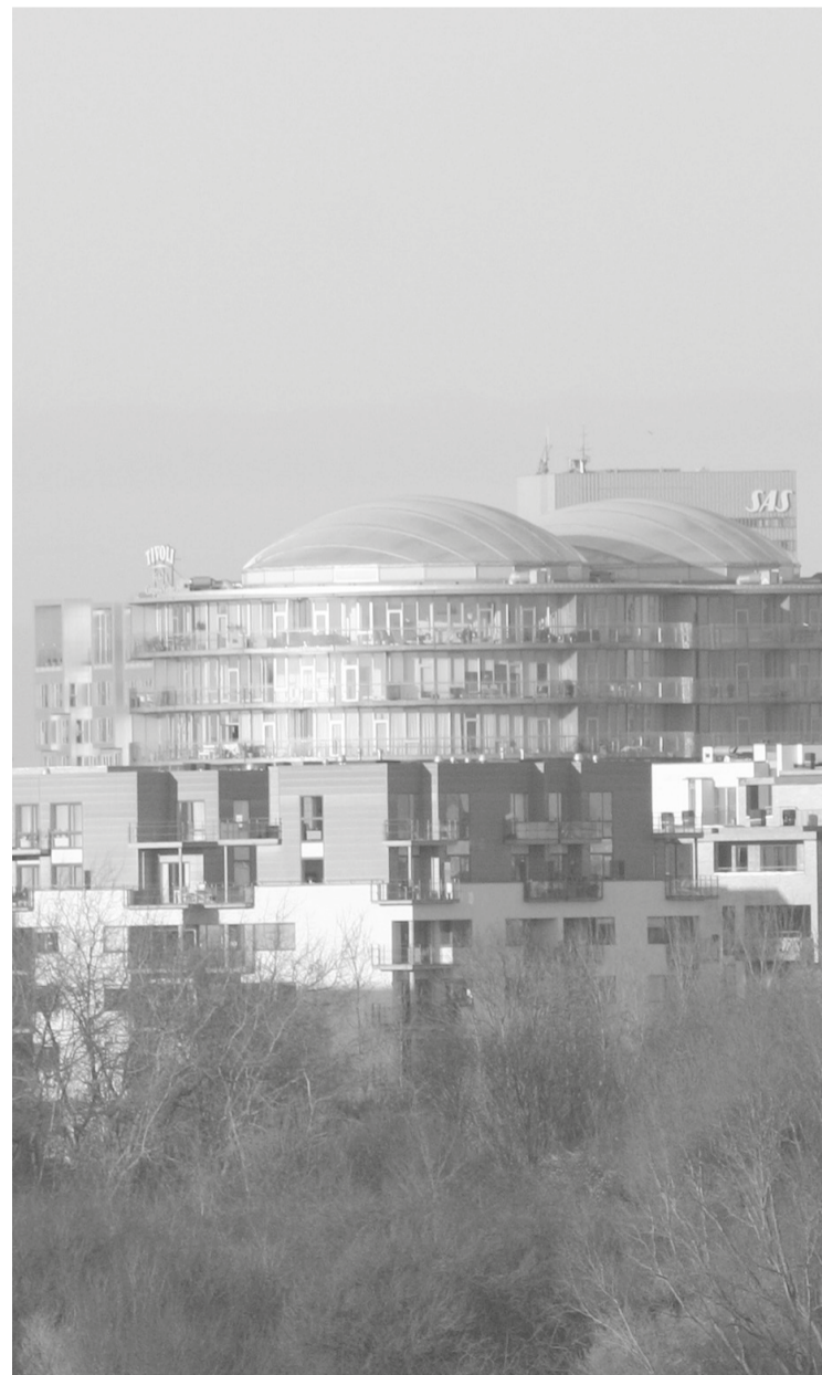
Nybyggeri i København.