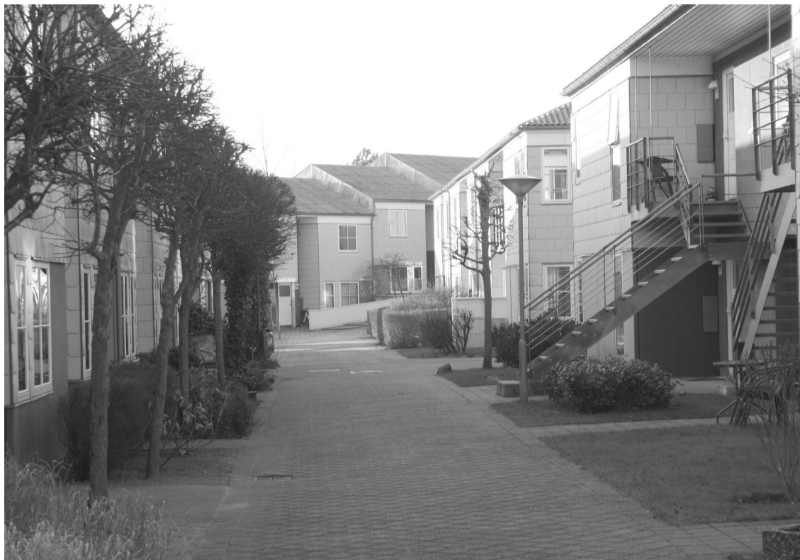
Møllegården i Herfølge, Køge Kommune

På trods af klare regler bliver DAB ved med at opkræve systematiske overskud i mange afdelinger i Køge.