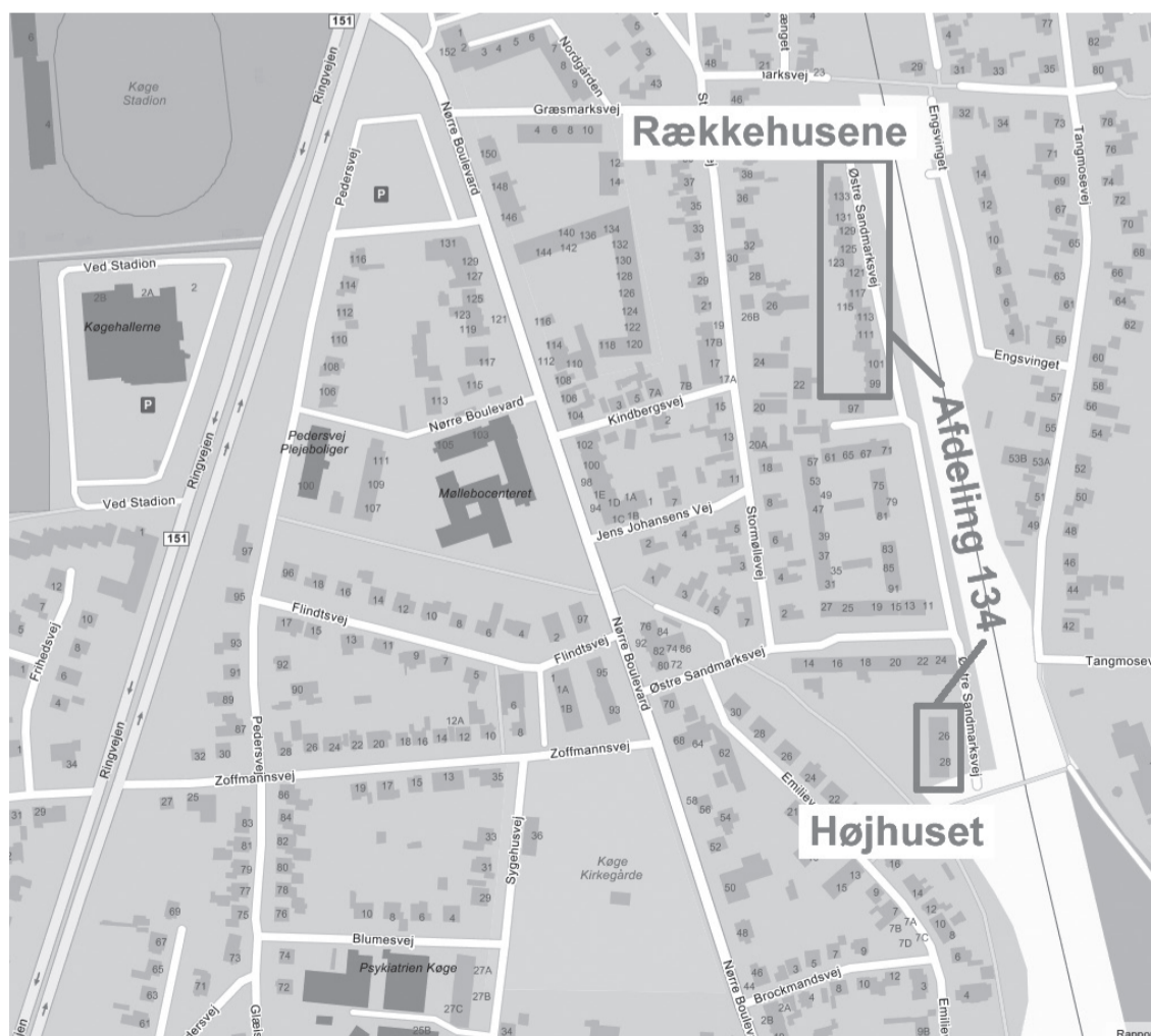
Kort over Lejerbo Køge Bugts afdeling 134