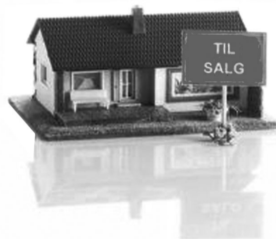
Udlejeren kunne ikke kræve istandsættelse af huset på fraflytterens regning, da huset blev solgt uistandsat

Dette var huslejenævnet åbenbart enig i. Dog fik udlejer medhold på et punkt: