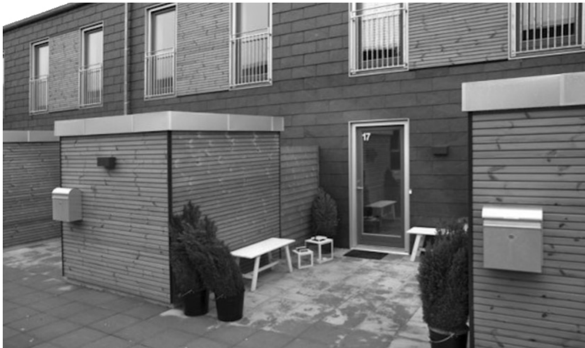
Uglevænget i Ejby

Her er fraflytningsrapporten et afgørende bevis, fordi rapporten dokumenterer, at lejligheden er blevet gennemgået. Den dokumenterer også, hvilke krav om istandsættelse, udlejer har fremsat under synet. Hvis det viser sig, at udlejer - som udfærdiger rapporten - har ændret i den, efter at synet er afsluttet mister fraflytningsrapporten sin værdi som bevis. Et enkelt kryds i en rubrik kan betyde, at lejeren skal betale mere for istandsættelsen. Derfor skal lejeren ved synets afslutning have en kopi af rapporten, så lejeren er sikker på, at alle de krav, der fremgår af rapporten er blevet fremsat af udlejer under synet.