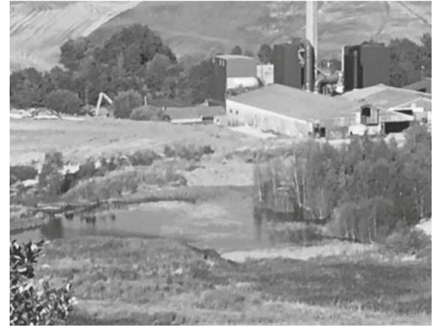
19.-23. december 2023: Firmaet stopper arbejdet. Kort efter fyres man 31 medarbejdere og stopper betaling til medarbejderne og kreditorerne.

16. december 2023: Efter pres fra flere byrådsmedlemmer med Bjarne Overmark i spidsen begynder Randers Kommune at iværksætte tiltag for at beskytte Alling Å.